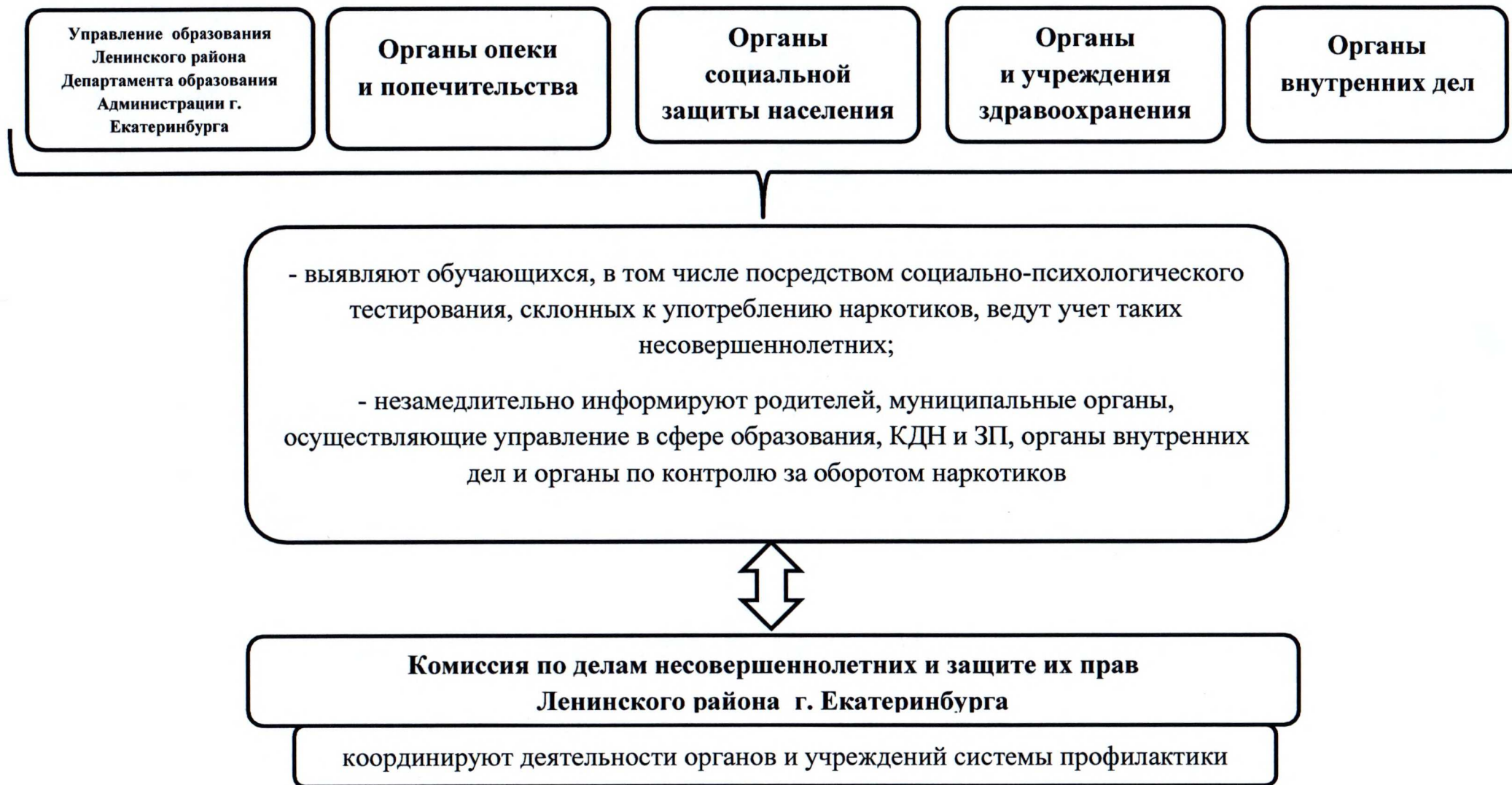
Схема 1. Выявление несовершеннолетних, употребляющих психоактивные и наркотические вещества, субъектами системы профилактики