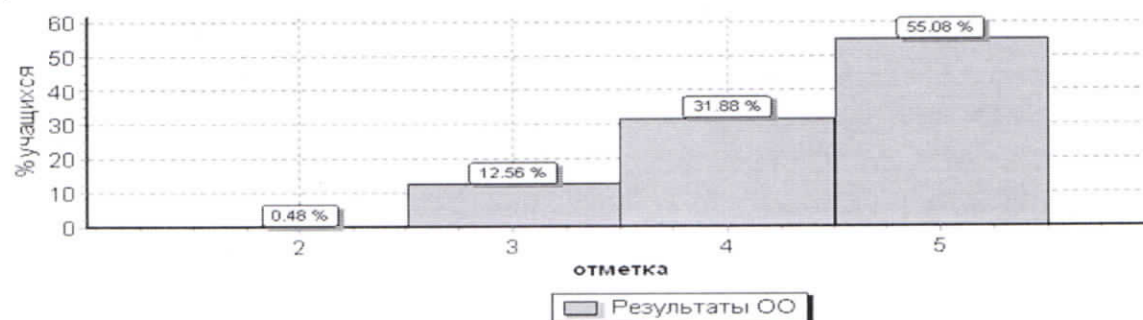
Соответствие отметок ВПР по математике и итоговых отметок.

ВПР по математике в 4 классах выполнили 207 учеников. Максимальный балл – 20. Минимальный – 7. На отлично написали 114 учеников (55%); на «хорошо» - 66 учеников (31,88%), на «удовлетворительно» - 26 учеников (12,56%), 1 ученик не справился с работой (0,48%). Данные результаты в переводе в пятибалльную шкалу соответствуют 87% качества образования.