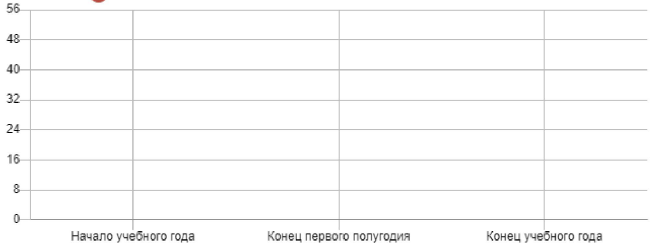
● Итоговый показатель уровня развития и сформированности умений и навыков