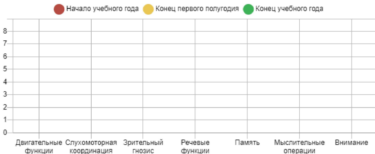
Сводная таблица уровня сформированности и динамики развития обучающегося за учебный год