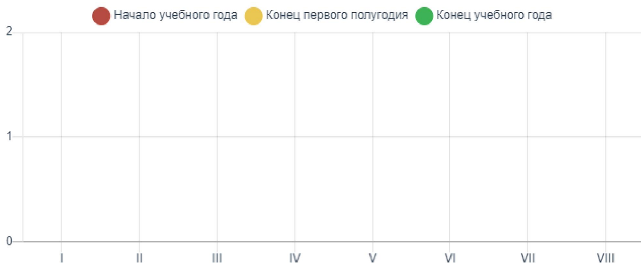
Сводная таблица уровня сформированности речевого развития за учебный год