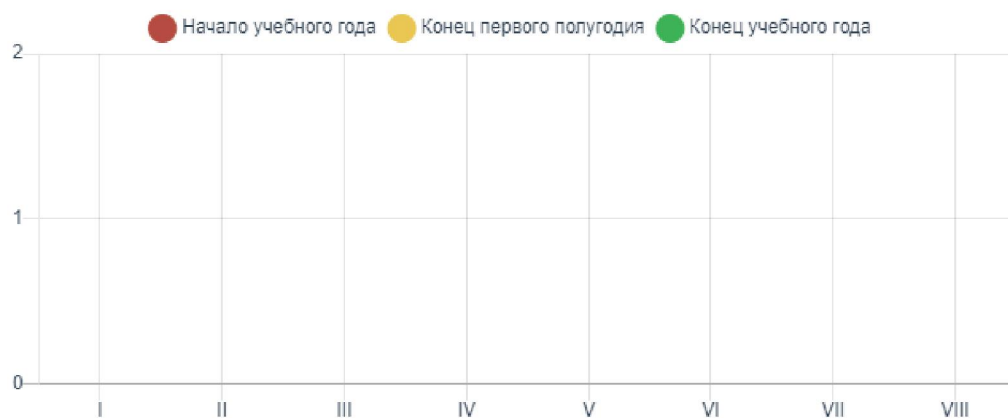
Сводная таблица уровня сформированности речевого развития за учебный год